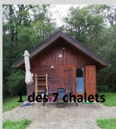
1 des 7 chalets