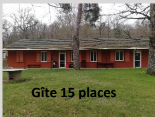
Gîte 15 places