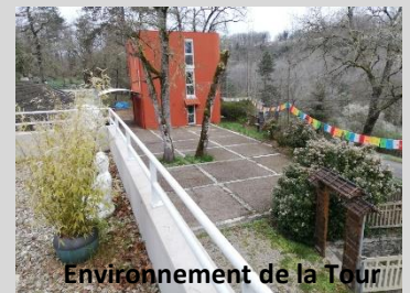
Environnement de la Tour