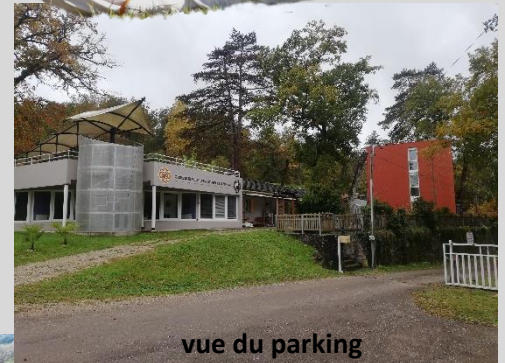
vue du parking